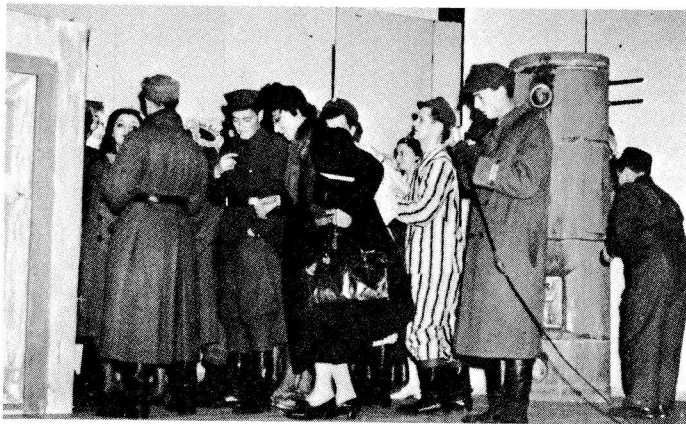
Viihdetilaisuus syksyllä 1943: ohjelma alkaa!