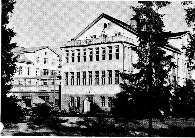
Sortavalan Vaaliala oli mahtava rakennuskompleksi