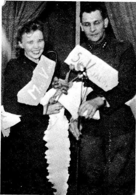
Viihdytystilaisuudessa on valittu "Miss Vaaliala"